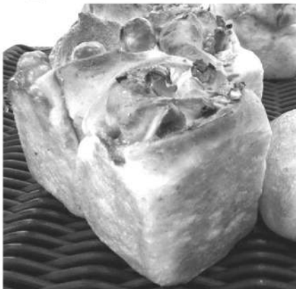
*売切れの場合がございます。ご了承ください。